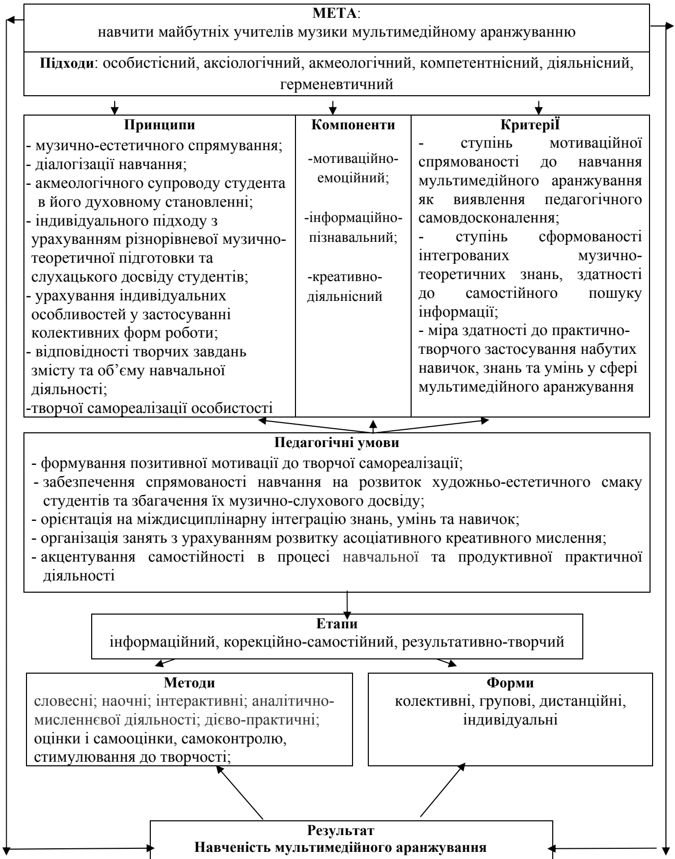
Рис. 1. Модель навчання майбутніх учителів музики мультимедійного аранжування